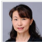
辻・本郷 税理士法人 ファミリーオフィス事業部 シニアパートナー 税理士