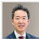
辻・本郷 税理士法人 プライベートウェルスマネジメント部 シニアパートナー 税理士