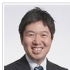
辻・本郷 税理士法人 相続センター責任者 シニアパートナー 税理士