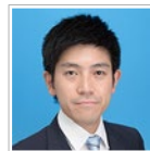
辻・本郷 税理士法人 吉祥寺事務所 シニアマネージャー 税理士