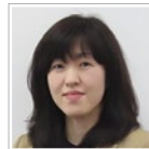
辻・本郷 税理士法人 仙台事務所 シニアマネージャー