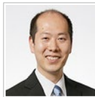
辻・本郷 税理士法人 立川事務所 パートナー 税理士